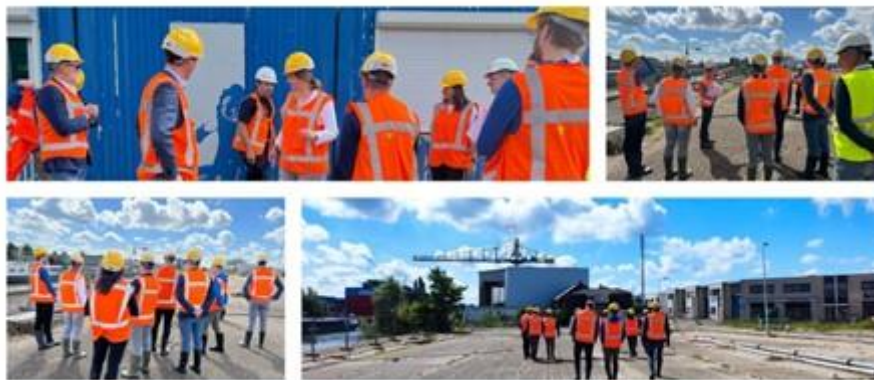
Werkbezoek 1 juli