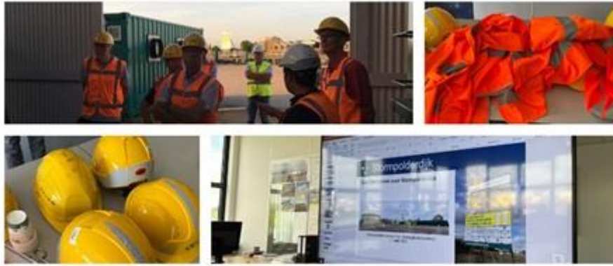
Rondleiding Klankbordgroep 29 juni